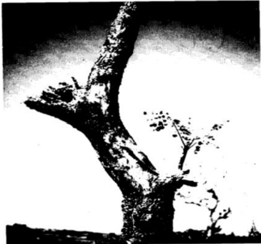
FIGURA 1 – Stripnodendrum barbatiman (Barbatimão)